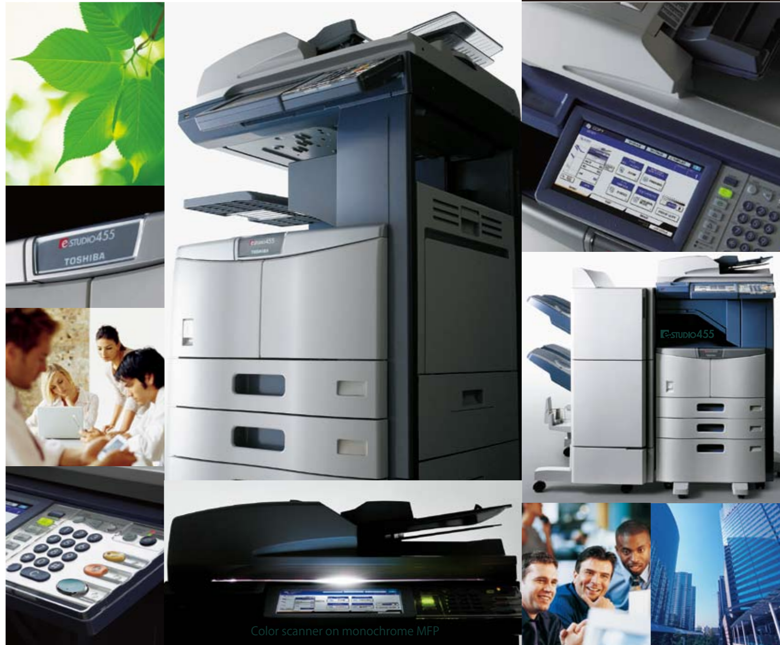
Color scanner on monochrome MFP